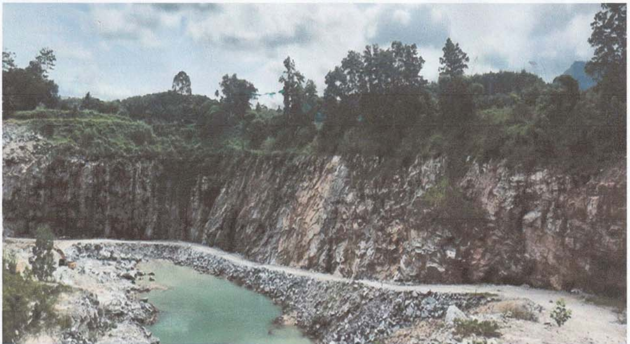
5. ปลุกต้นไม้ยืนต้นที่สามารถเจริญเติบโตได้ดีในพื้นที่ประทามบัตร