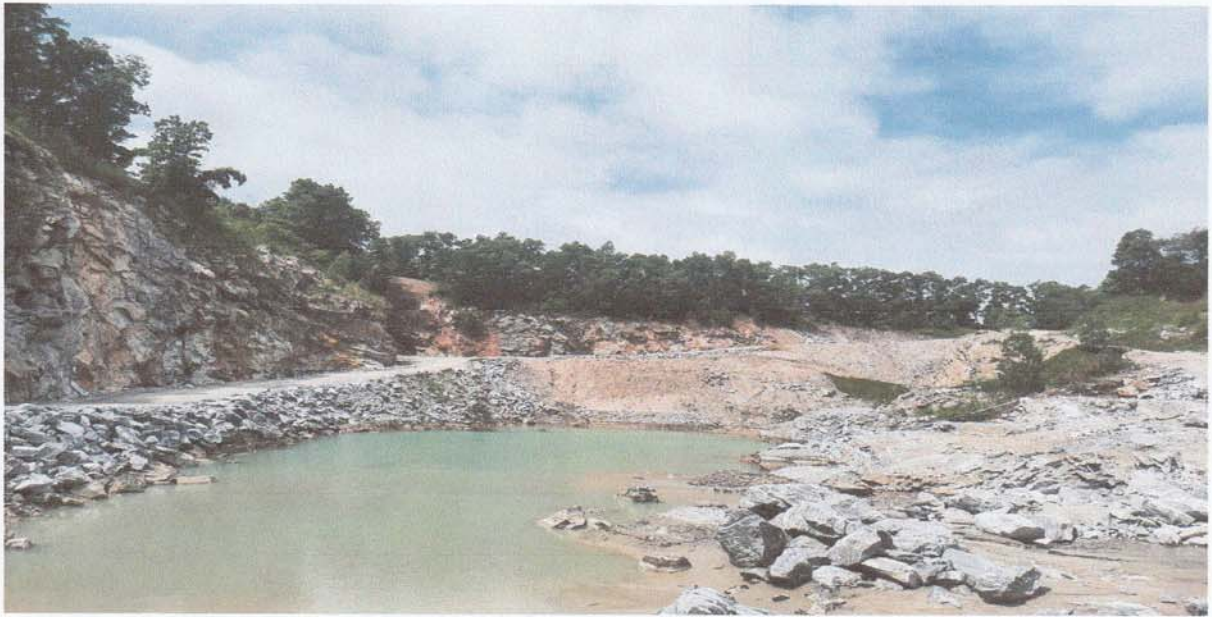
2. บริเวณขอบบ่อเหมืองทางทิศตะวันออก