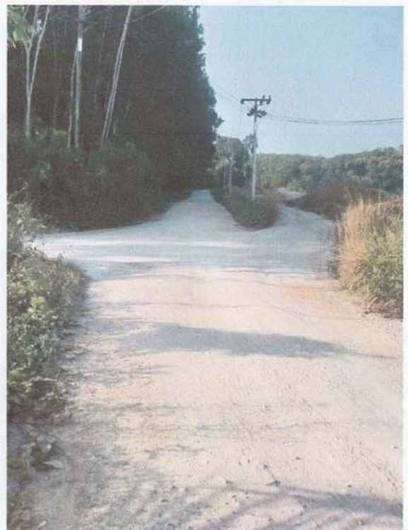
3. ปรับปรุงเส้นทางเข้า ออกเหมืองเชื่อมต่อถนนหลักของชาวบ้าน