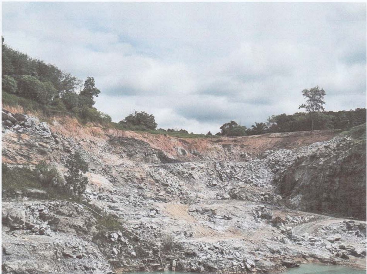
1. การปรับปรุงหน้าดินและชั้นดินบริเวณขอบบ่อทางด้านทิศเหนือของโครงการที่มีน้ำซึมผ่าน

3. แผนการดำเนินงานในช่วง 1 ปี ข้างหน้า ในช่วงนี้จะทำการฟื้นฟูพื้นที่บริเวณหน้าเหมือง ชั้นบันไดที่สิ้นสุดการทำเหมืองแล้วต่อเนื่องจากการฟื้นฟูของปีที่ผ่านมา ทางด้านตรงกลางของโครงการที่มี น้ำท่วมขังและทิศตะวันออกไปทางทิศใต้เพื่อในสามารถใช้เส้นทางขนส่งแร่ได้ต่อเนื่องกันและลด อุบัติเหตุจากความลาดชันของชั้นบันไดหลังการทำเหมืองแร่ และปรับชั้นบันไดหลังการทำเหมืองให้มีความ สูงไม่เกิน 45 องศา รวมทั้งดูแลรักษาพืชคลุมดินและไม้ยืนต้นและผลไม้ประจำท้องถิ่นที่สามารถเจริญเติบโต ได้อย่างต่อเนื่องบริเวณคันนบดิน และการฟื้นฟูบ่อน้ำระบบป้องกันการชะล้างตะกอนดินจากบริเวณหน้า เหมืองที่เก็บกองเปลือกดิน / เศษหิน และบริเวณอื่น ๆ อาทิเช่น คันนบดินและคูระบายน้ำ และบ่อดักตะกอน เป็นต้น ขั้นตอนการฟื้นฟูโดยการขุดลอกมิให้ดินเงิน ตกแต่งให้อยู่ในสภาพที่สามารถระบายน้ำได้ดีไม่ขัง หนอง รวมไปถึงทำถนนทางขึ้นลงในบ่อเหมืองยาวไปถึงถนนทางขนส่งแร่ที่เชื่อมต่อกับถนนหลักของ ชาวบ้านประมาณ 25 กิโลเมตรที่ทางโครงการได้ทำอยู่แล้วอย่างต่อเนื่องซ่อมแซมให้อยู่สภาพที่พร้อมใช้ งานลดอุบัติเหตุที่อาจจะเกิดขึ้นให้ได้มากที่สุดเพื่อความปลอดภัยของทุกคนที่ใช้ถนนเส้นนี้