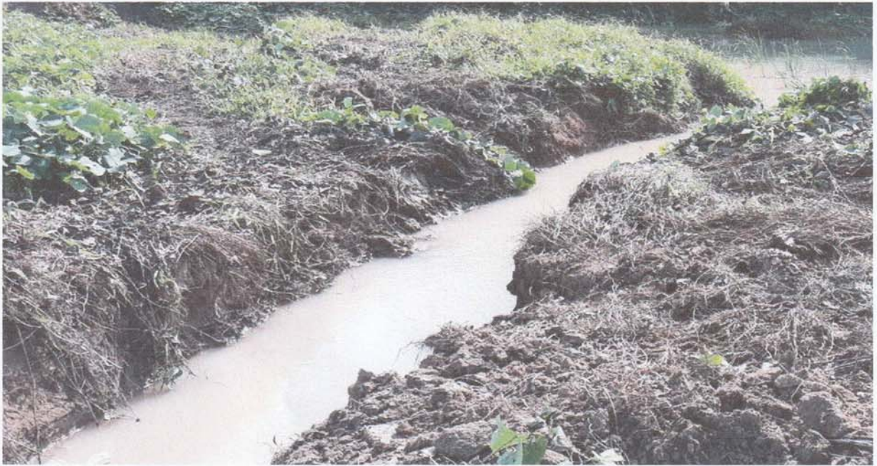
4. จุดลอกคูระบายน้ำ